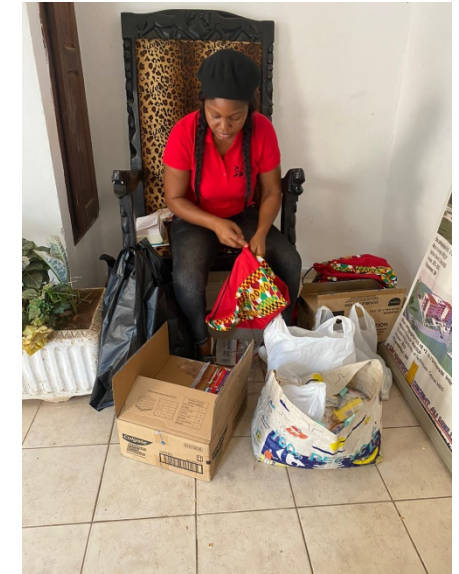
Préparation des sacs pour nos patients