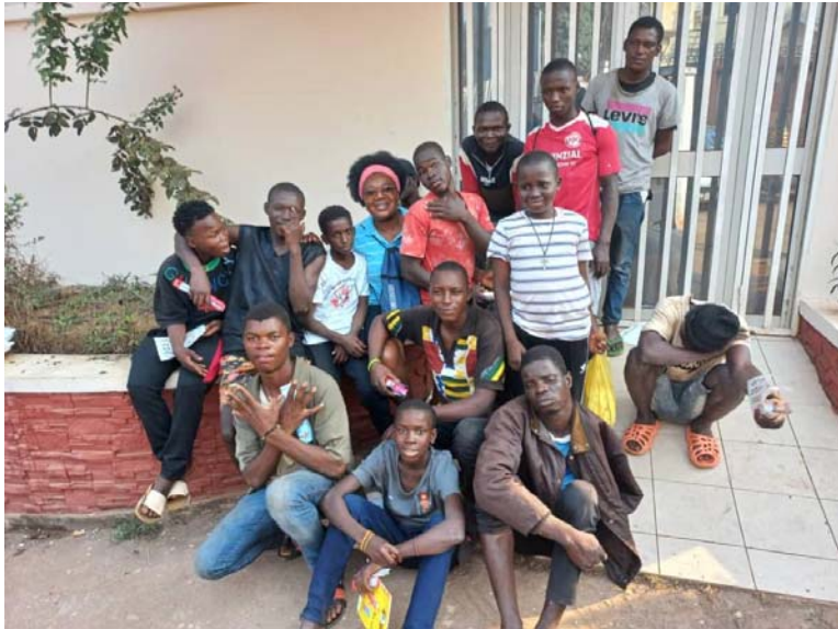
Arrivée d'une partie des enfants de la rue au centre SAVI