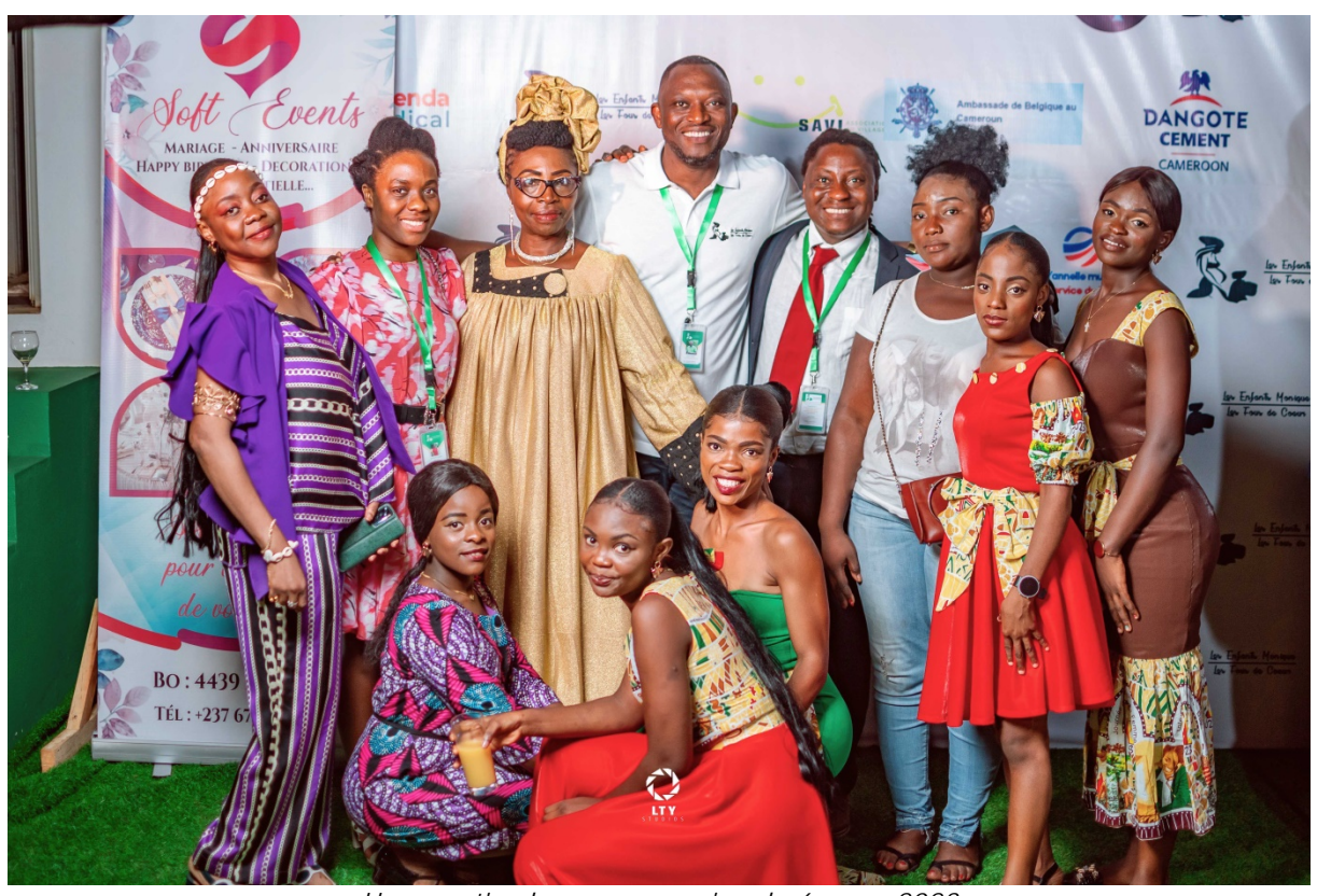
Une partie des mannequins du 6 mars 2023