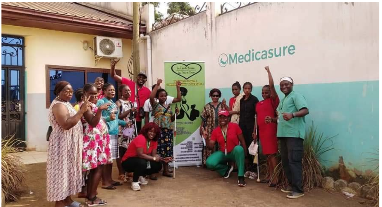
Les femmes du centre M.E.A à la clinique Kutenda Medical