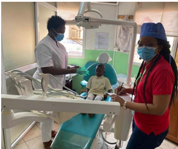
Les Enfants Monique – Les Fous de Cœur et SAVI en plein soin