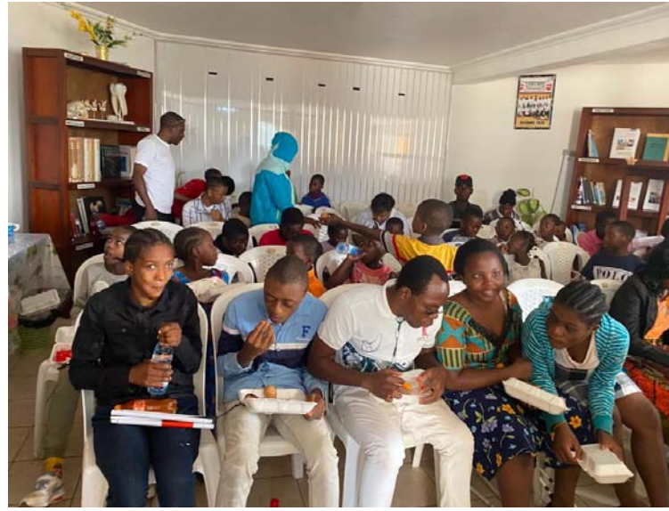
Les patients du jour en salle d'attente du centre SAVI