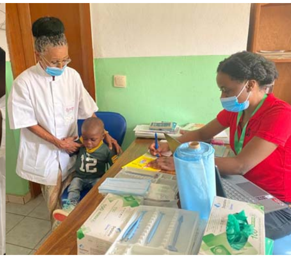
Chaque patient a eu son carnet de santé