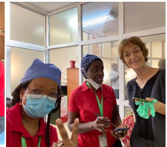
L'épouse de S.E. l'ambassadeur du Royaume de Belgique au Cameroun pleinement investie dans la campagne.