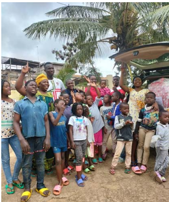
Orphelinat Fact, Juillet 2022