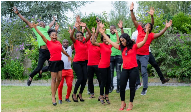
Assemblée générale 2020