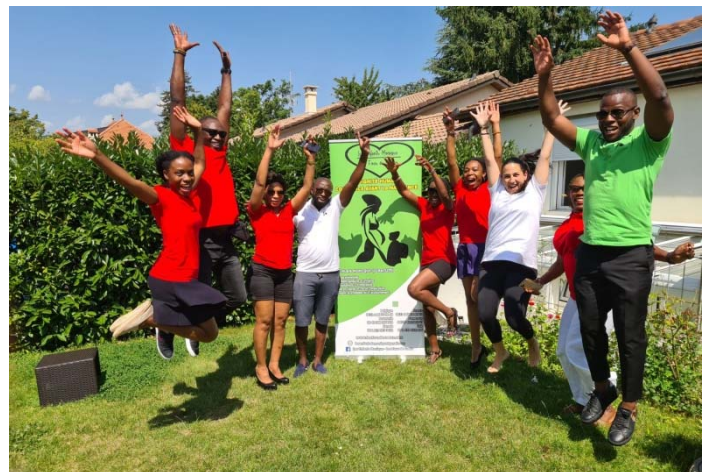
Assemblée générale 2021

« La dignité humaine commence avant la naissance »