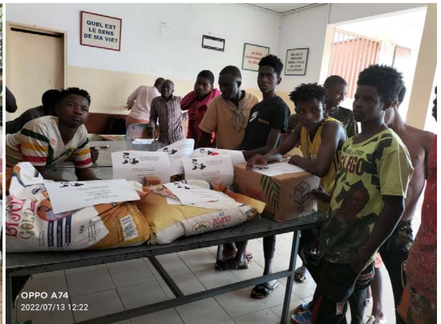
Centre social Edimar, Juillet 2022