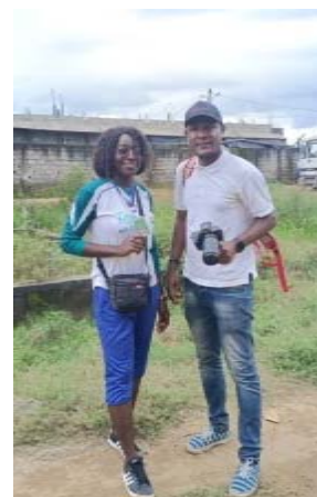
Une partie de nos relais et bénévoles au Cameroun