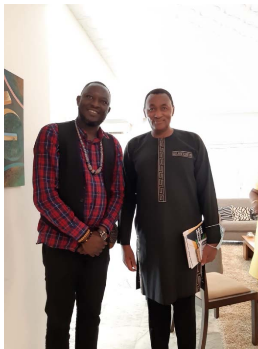
Rencontre avec le Directeur de l'OMS au Cameroun