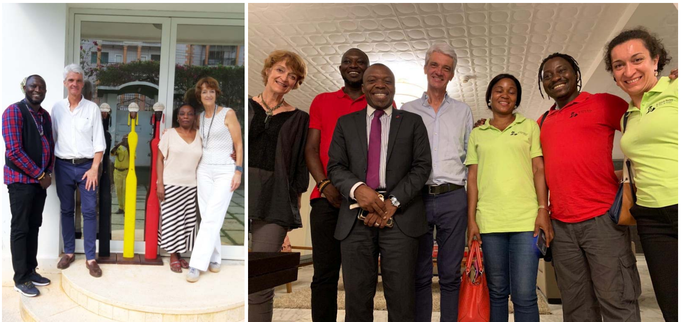
Rencontre avec S.E. Monsieur l'Ambassadeur du Royaume de Belgique au Cameroun et son épouse.

Nous avons longuement échangé sur nos actions et nos difficultés. Nous exprimons toute notre gratitude à S.E. Monsieur l'Ambassadeur ainsi qu'à son épouse pour leur démarche et leur écoute. En effet, c'est un immense plaisir de voir notre travail reconnu et apprécié par une autorité diplomatique de ce rang.