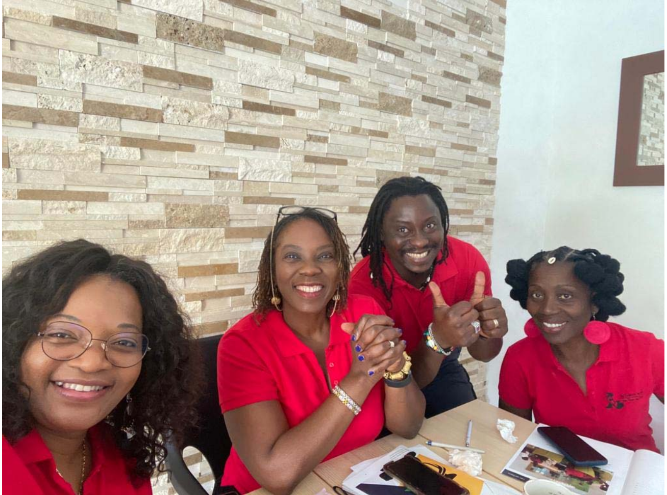
Les Fous de cœur : une chaîne de solidarité pour sauver la Mère et l'Enfant