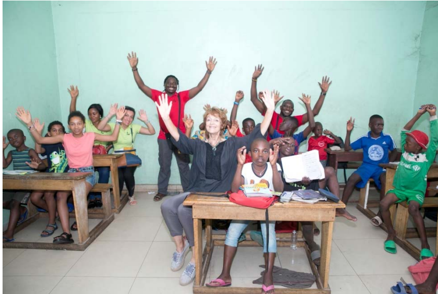
Visite à l'orphelinat Ngoul-Zamba, avril 2022