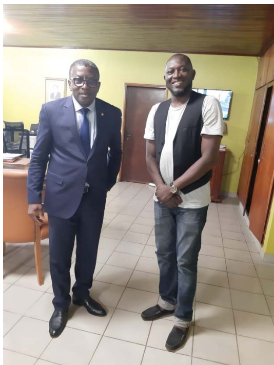
Rencontre avec le maire de Douala 3ème

Afin de faire connaître l'association auprès des pouvoirs publics au Cameroun, nous avons sollicité et pu rencontrer diverses autorités locales :