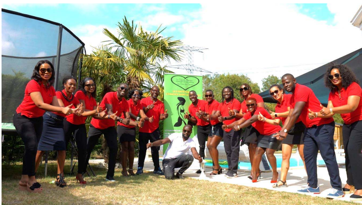
Une partie des membres lors de l'assemblée générale 2022 à Bordeaux (France)

L'association est composée d'une quarantaine de membres et de plusieurs bénévoles qui vivent dans plusieurs pays différents. Une fois par an, l'association organise une assemblée générale pour valider les comptes et faire le point sur le travail réalisé, les difficultés rencontrées et les projections. C'est aussi un moment de rencontre et de convivialité. En 2022, l'assemblée générale a eu lieu dans la ville de Bordeaux en France. Comme les années précédentes, les frais liés à cette assemblée générale (déplacement, nutrition, logement) ont été assumés par les membres présents.