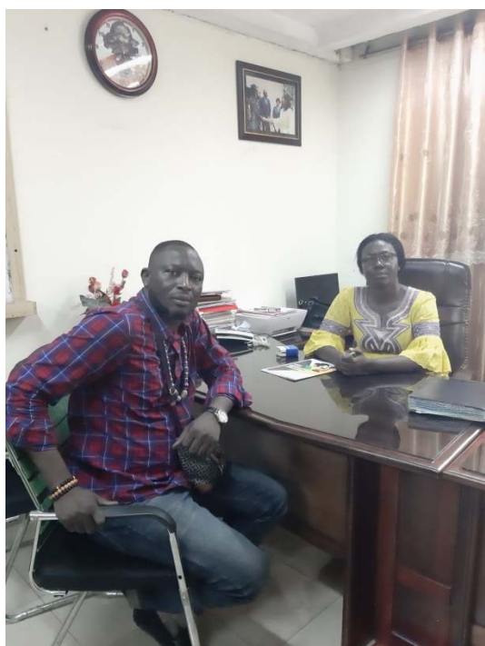
Rencontre avec la directrice de l'Ecole Nationale Supérieur de Bertoua