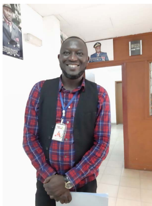
Après l'entretien avec le gouverneur du Littoral